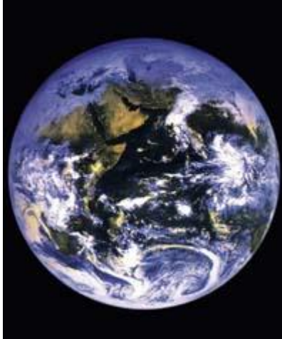
أمن جعل الأرض قرارا

متوسط كثافة الصخور البازلتية المكونة لقيعان المحيطات=2,9 جرام/للسنتيمتر المكعب